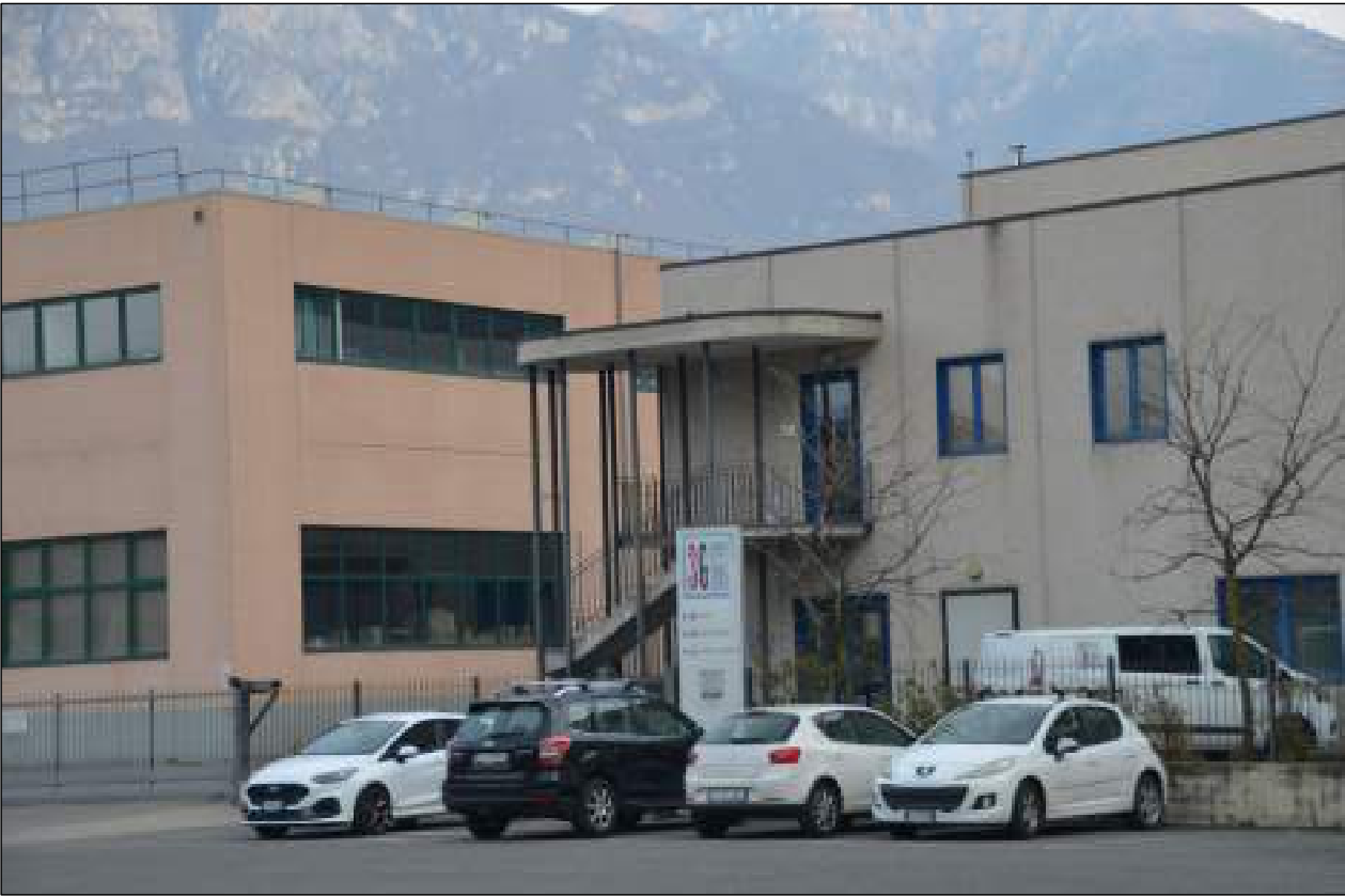
VISTE DAL PIAZZALE ANTISTANTE